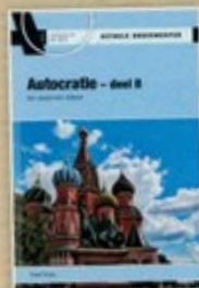
A0 3098 Autocratie - deel II