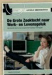
A0 3097 De Grote Zoektocht naar Werk- en Levensgeluk