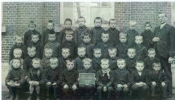
Een klas uit het begin van de 20e eeuw

Het is heel bijzonder dat de Grondwet zo'n uitvoerige aandacht schenkt aan het onderwijs. Dit in tegenstelling tot andere grondrechten, zoals die van sociale zekerheid en dergelijke. Maar dat is dan ook niet voor niets. In ons land heeft zich een langdurige strijd afgespeeld over de plaats van het bijzonder onderwijs ten opzichte van het openbaar onderwijs. Deze strijd is beslecht in 1917 met de zogenoemde pacificatie (vrede), waarbij het bijzonder onderwijs dezelfde rechten en plichten kreeg als het openbaar onderwijs. De strijd was zo hevig geweest, de 'vrede'