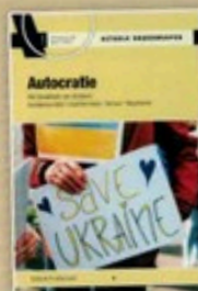
A0 3096 Autocratie

Kijk op onze website voor abonnementen en losse uitgaven: