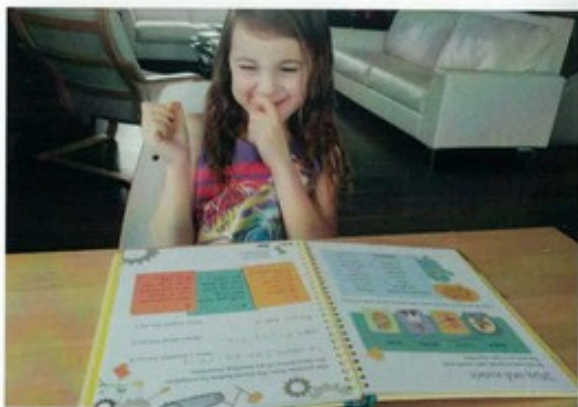
Thuisonderwijs – een bijna onvoorstelbaar grote groep jongeren in de leerplichtige leeftijd zit niet op een school

de makke van het geheel duidelijk. Al deze regels staan ten dienste van het bestuursorgaan van de overheid, duidelijk patriarchaal geformuleerd zonder echte ruimte voor de burger. Bovendien staat het geheel op gespannen voet met de Grondwet, namelijk dat het onderwijs vrij is binnen kwaliteitseisen. In werkelijkheid betreft die vrijheid alleen de vrijheid van oprichting en van inrichting en daarmee is het met de genoemde vrijheid wel gedaan. Want "Vadertje staat weet wat goed voor u is".