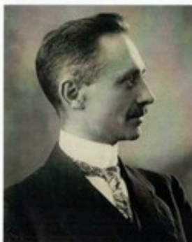
Jan Terpstra, antirevolutionaire jurist, onderwijsdeskundige en minister van Onderwijs in het derde kabinet-Ruijs de Beerenbrouck 1929-1933.

Afgezien van het bepaalde onder het derde gedachtenstreepje, zijn de teksten achter de eerste twee tamelijk ruim geformuleerd. Wat zijn bijvoorbeeld 'psychische gronden'? Wat de een een grond voor vrijstelling vindt, zal een ander die wellicht betwisten. Een welles/nietes gevecht met de leerplichtambtenaar ligt dan op de loer. En dan de 'richting', namelijk