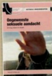
A0 3098 Ongewenste seksuele aandacht