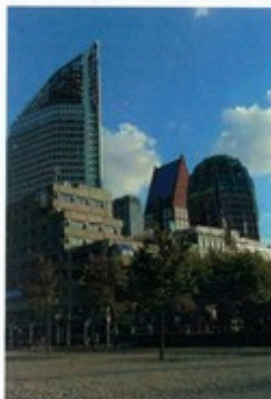
Het ministerie van Onderwijs, Cultuur en Wetenschappen in Den Haag

Niet alleen vakbekwaamheid als thuisonderwijzer, maar ook het kunnen opbrengen van de discipline om dag in dag uit met hun kinderen